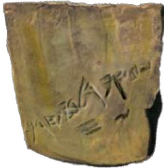
אוסטרקון עם כתובת בעברית מתל קסילה - "זהב אופיר לבית דורון"

ופולחניים. ערכו של הזהב הביא לא אחת לכך שתכשיטי או חפץ אחר צופה ברדיד זהב כדי ליצור אשליה של עושר. עם התפתחות המסחר, הפך הזהב גם לאמצעי תשלום. בתחילה, נקבע ערכו של הזהב בצורה גולמית או כפריט כנגד יחידת משקל מוכמכת, ובשלב מאוחר יותר, כמטבע.