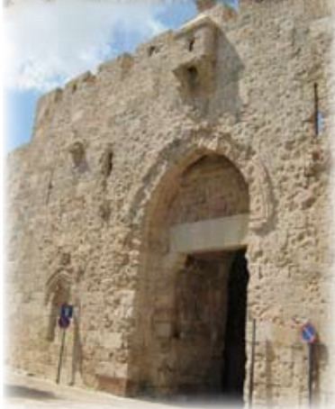
שלער ציון במרוצת הזמן

נכון לסוף שנת 2008 הושלמה העבודה בשלושה מקטעי עבודה: מקטע 'כיכר צה"ל', מקטע 'חומת המצודה הייצונית' ומקטע 'הר ציון' הכולל את הטיפול בשלער ציון בו נמשך הטיפול ששה חודשים.